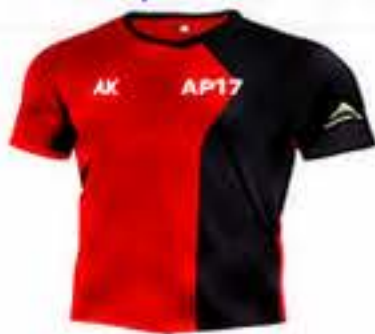
MAILLOT CLUB Tailles : 3XS à 3XL

Équipements disponibles à la vente sur commande.